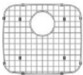
Grille(s) de fond/ Bottom Grid(s) GR045