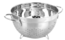
Tamis/ Colander COL003B

GARANTIE LIMITÉE NAUTIKA OFFERTE À L'ACHETEUR - ÉVIERS À USAGE RÉSIDENTIEL (extrait du texte complet de la garantie disponible sur Nautika.ca) Les éviers Nautika sont garantis contre les défauts de matériaux ou de fabrication, dans les conditions d'usage domestique normales pour lesquelles ils ont été conçus cette garantie reste en vigueur tant que vous restez propriétaire de votre évier.