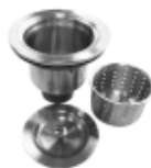
Crépine-panier/ Basket Strainer BP38